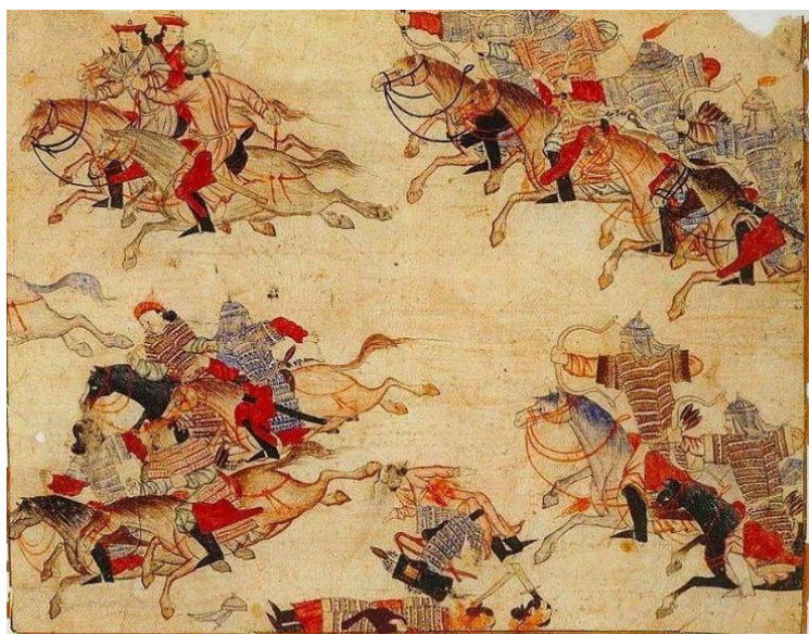
Миниатюра из «Сборника летописей». XIV в.

режим был крайне неуравновешенным. Плодородные долины крупнейших рек страдали от периодической смены паводков засухами. Устойчивое земледелие было возможно лишь при наличии сложной системы по отводу, накоплению и сбережению воды. Это требовало огромных временных затрат и сил. Необходимость ирригации сделала невозможной индивидуализацию хозяйственной деятельности. В восточных цивилизациях преобладала государственная собственность на землю и, как следствие, неограниченная власть главы государства над подданными, лишенными гарантированной собственности.